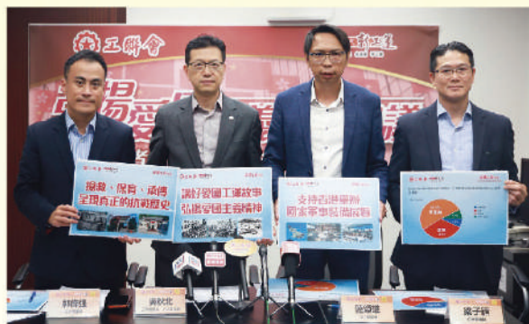
| 2024-06-20 工聯會公布弘揚愛國主義教育倡議暨問卷調查結果。