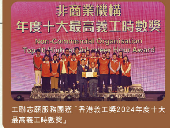
工聯志願服務團獲「香港義工獎2024年度十大最高義工時數獎」