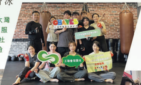
2024年6月22日，「大灣區青年就業計劃支援服務」系列活動，灣區社組織港青進行拳擊體驗小組活動

灣區社更在灣區各市，為計劃參加者準備了豐富的小組活動，如密室逃脫、劇本殺、手作DIY、射箭、羽毛球、滑冰