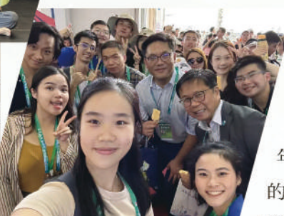
2024年11月12日至14日，灣區社受特區政府駐粵辦邀請，組織10位計劃參加者及在穗學生到珠海參加中國航展活動