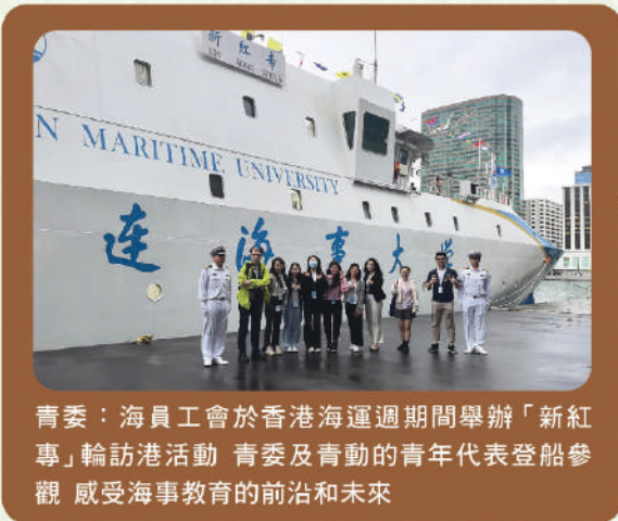
青委：海員工會於香港海運週期間舉辦「新紅專」輪訪港活動 青委及青動的青年代表登船參觀 感受海事教育的前沿和未來

電梯工會：關注扶手電梯致命工業意外 約見勞工處提出建議 期望處方加強監管及安全培訓