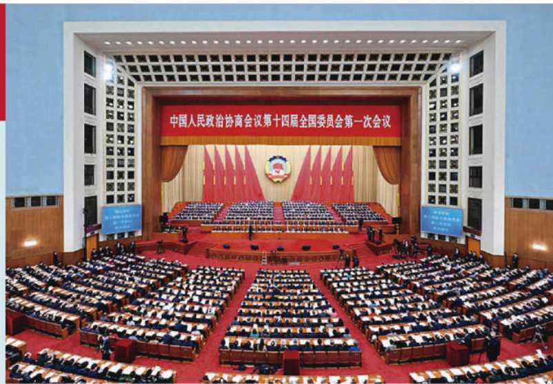
中國人民政治協商會議第十四屆全國委員會第一次會議

屆全體會議在北平隆重舉行，宣告中國人民政治協商會議正式成立。會議通過了《中國人民政治協商會議共同綱領》、《中國人民政治協商會議組織法》、《中華人民共和國中央人民政府組織法》這三個為新中國奠基的歷史性文件。會議還通過了關於國旗、國歌、國都、紀年等多項決議，並選出第一屆全國政協委員。當時正值新中國成立前夕，還不具備召開普選的全國人民代表大會的條件，是政協肩負起執行全國人民代表大會職權的重任，完成了建立新中國的歷史使命。