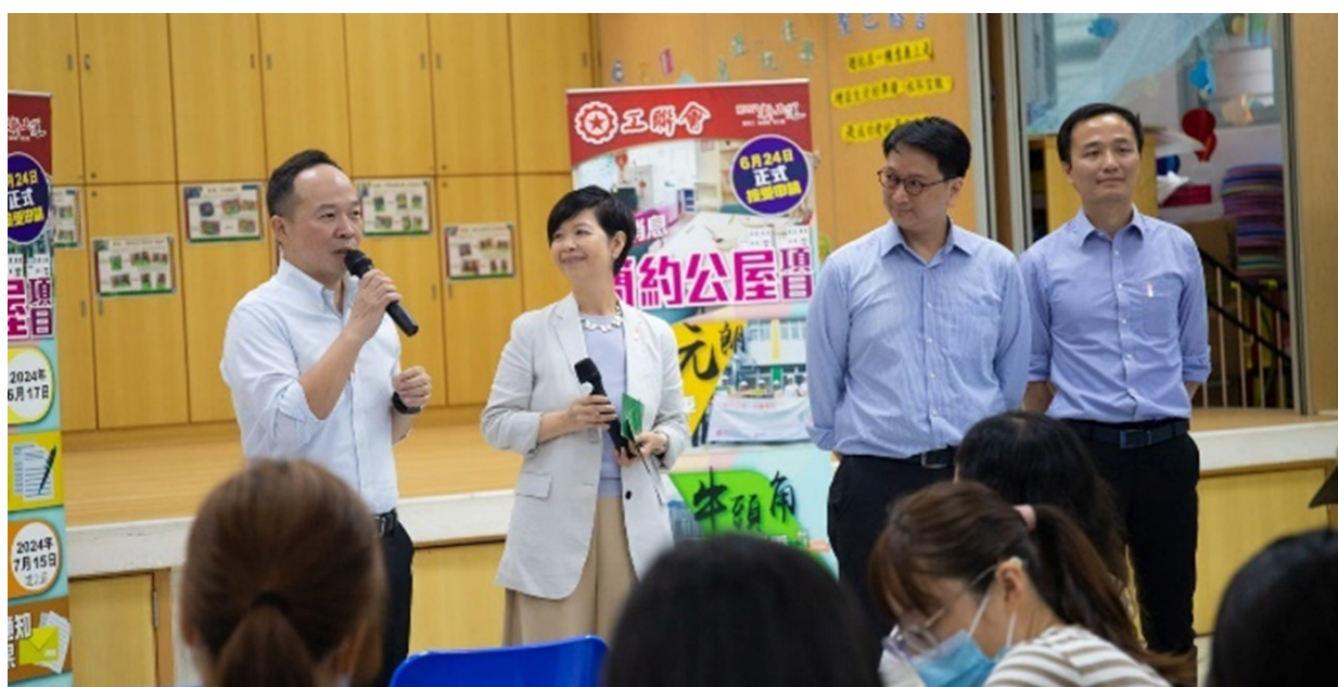
房屋局局長何永賢，立法會議員鄧家彪、陳穎欣，區議員簡銘東、余邵倫向觀塘區劏房居民介紹簡約公屋並討論劏房規管