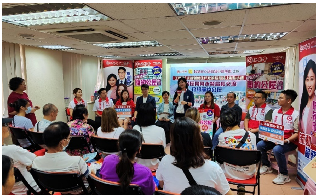
房屋局局長何永賢，立法會議員陳穎欣，區議員葛兆源、歐志輝、李偉樂、陳安妮、蘇栢燦、周潔瑩，社區幹事夏泳迦、孔潤生向荃灣區劏房居民介紹簡約公屋並討論劏房規管