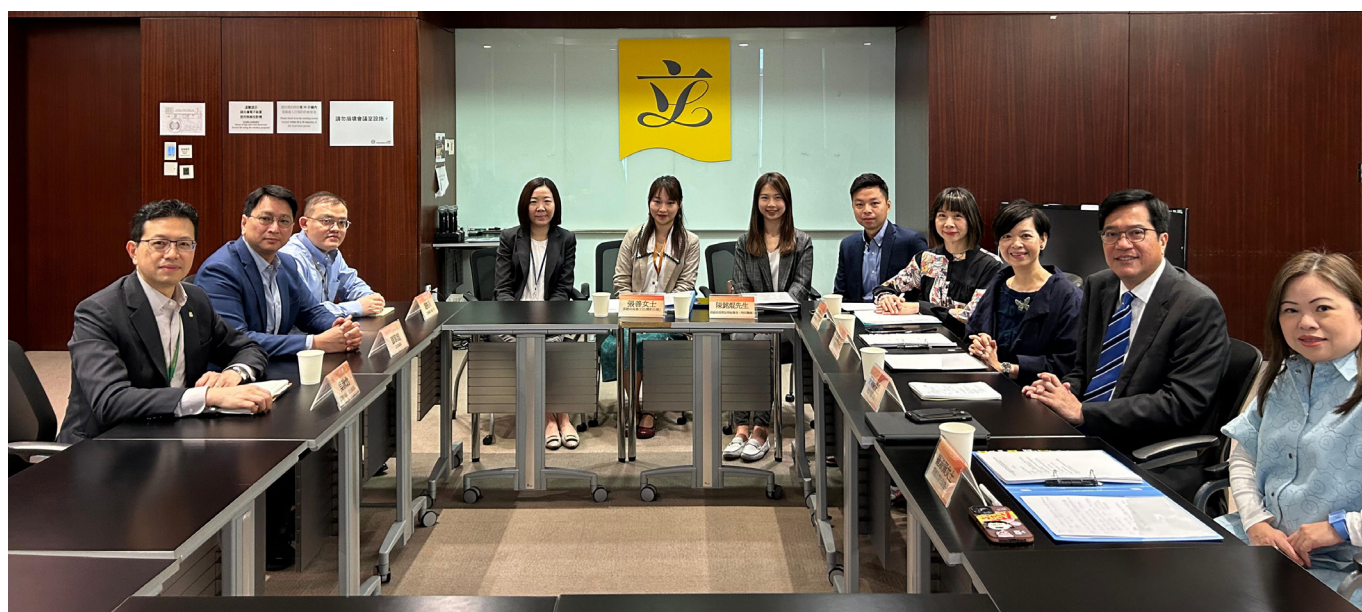
工聯會立法會議員吳秋北、鄧鈺彪與政府「解決劏房問題」小組組長財政司副司長黃偉綸、副組長房屋局局長何永賢，以及房屋局常任秘書長羅淑佩等官員會面